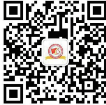
学院团委官方微信公众号