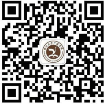
学院官方微信公众号